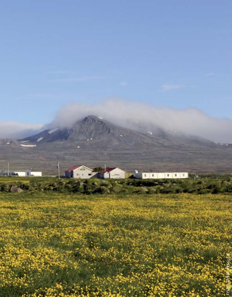
De boerderij van Sverrir en Mirjam, zowel links als rechts, in het landschap van Langanes.