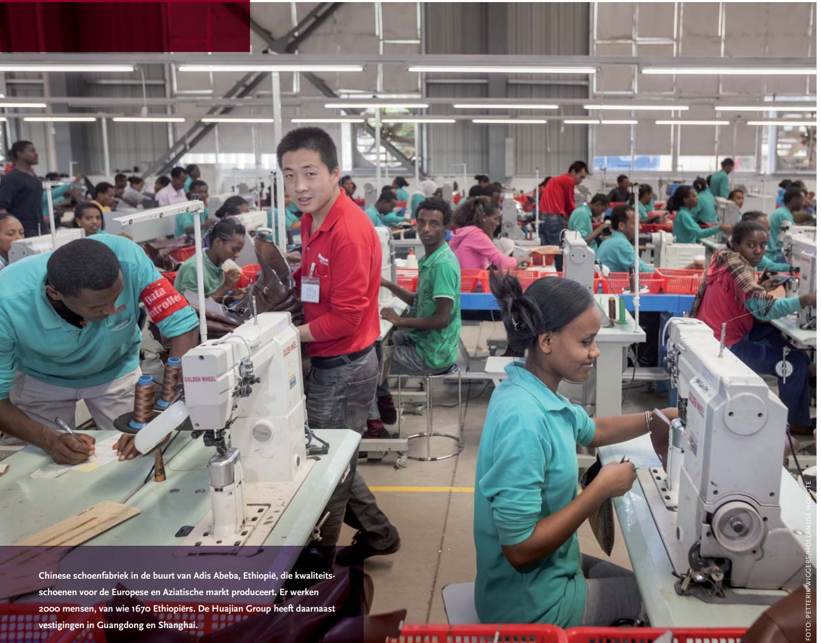
Chinese schoenfabriek in de buurt van Adis Abeba, Ethiopië, die kwaliteits-schoenen voor de Europese en Aziatische markt produceert. Er werken 2000 mensen, van wie 1670 Ethiopiërs. De Huajian Group heeft daarnaast vestigingen in Guangdong en Shanghai.