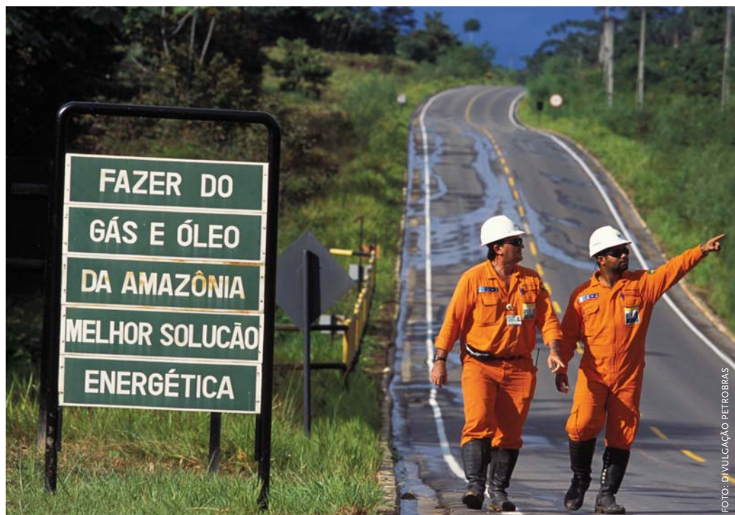
Werknemers van Petrobras bij de aanleg van de pijpleiding tussen de Urucuvelden en Manaus. Op het bord staat: 'Gas- en oliewinning in het Amazonegebied is de beste energieoplossing'.