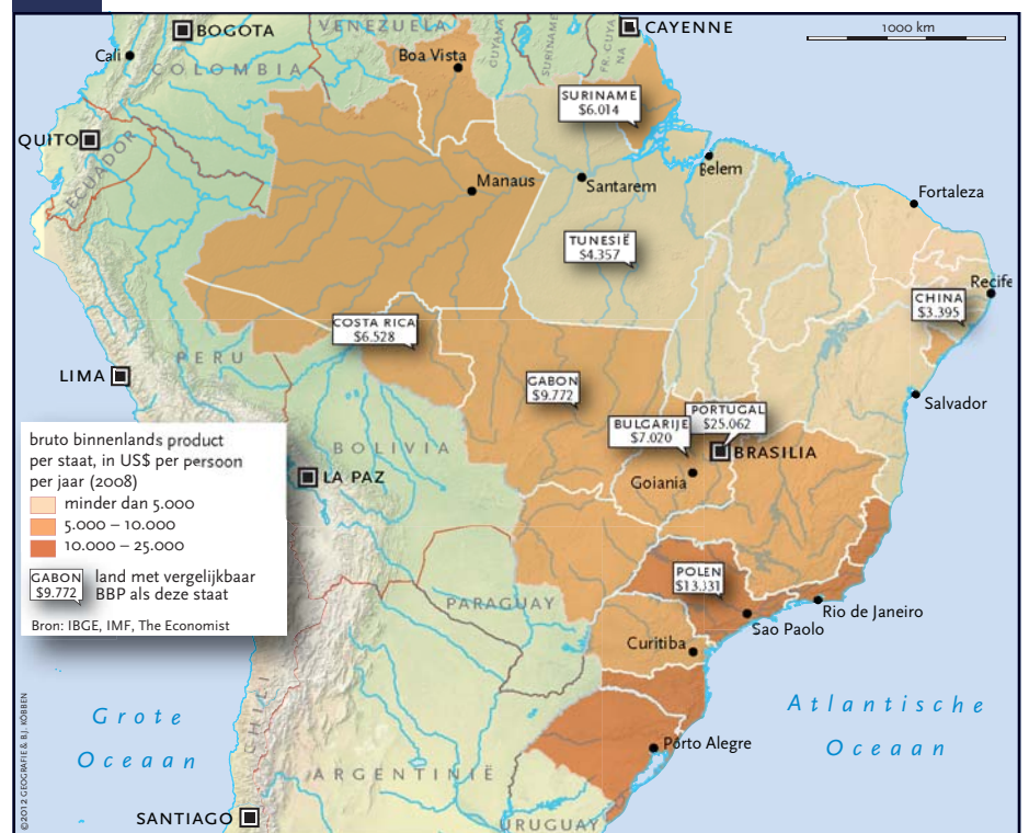
Figuur 1: Regionale verschillen in bruto binnenlands product

De familie Alessandri staat model voor de snel opkomende middenklasse in Brazilië.