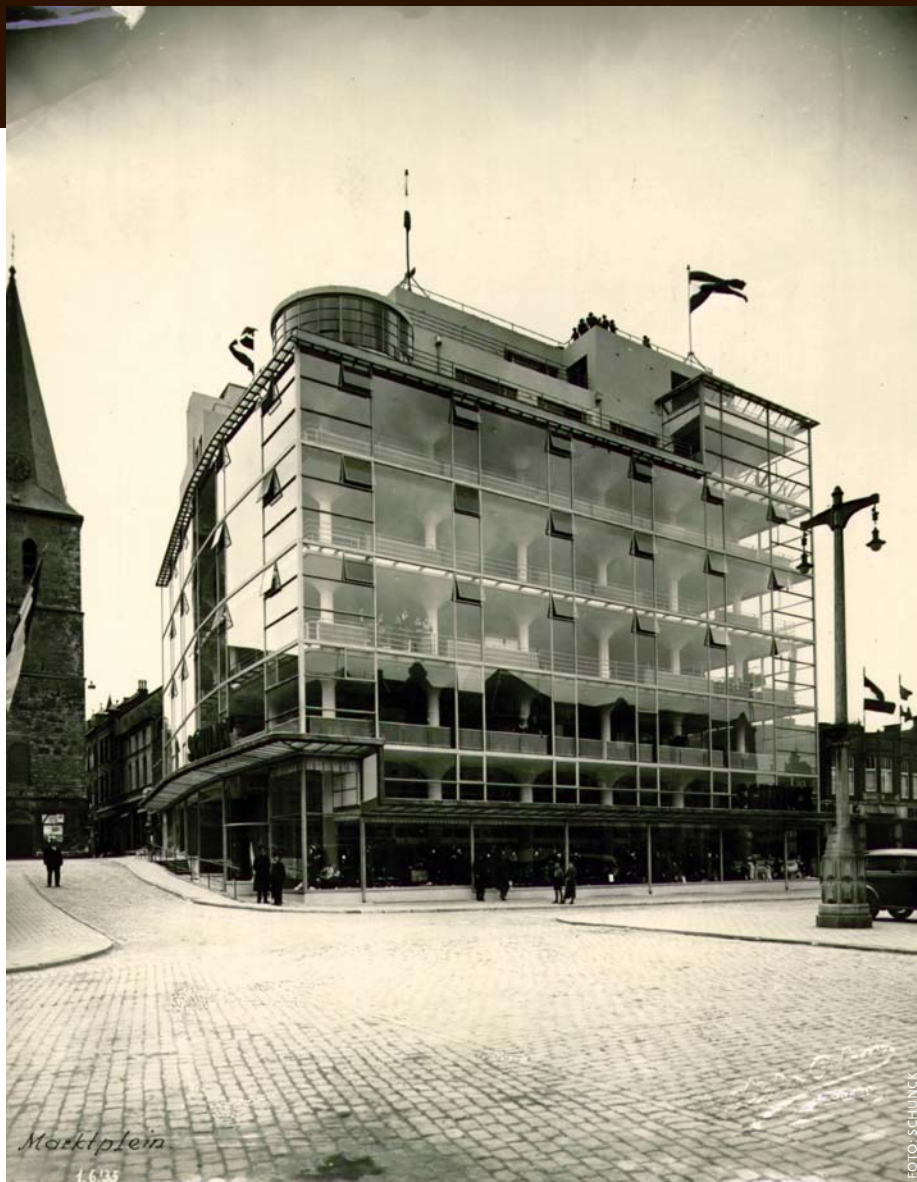
Opening Glaspaleis van de firma Schunck (1935), in 2009 heropend als multidisciplinaire culturele instelling, 'gespecialiseerd in Moderniteit en Urban-Culture'.

moet noord en zuid verbinden – deze twee stadsdelen zijn van oudsher gescheiden door de spoorlijn Sittard-Herzogenrath. In dit gebouw komen kleine winkels, kantoren en een statig station. Aan de zuidzijde van het spoor bevindt zich links de poort naar het Maankwartier met daarin een restaurant, woningen, winkels en een viersterrenhotel met 90 tot 100 kamers. Rechts komt een complex van zeven verdiepingen met onderin grootschalige detailhandel en daarboven koop- en huurwoningen. Ervoor is een stadspark gepland.