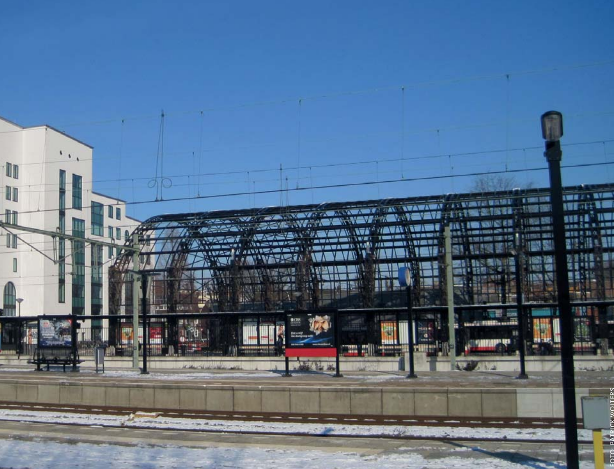
Het opgeknapte busstation met links de witte Hoppenhof, een voorproefje van de bouwstijl voor het hele stationsgebied.