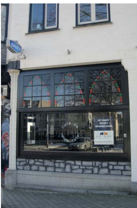
In het centrum van Heerlen staan talloze winkelpanden leeg; hoe moet dat als er straks 14.000 m 2 winkelruimte bijkomt?

Hart van het Maankwartier is het Maanplein met de Maantoren, een kunstwerk van Huisman. Een nieuw gebouw over het spoor