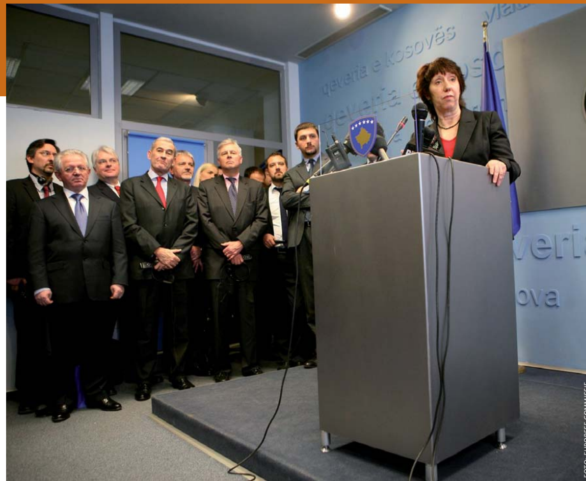
Catherine Ashton, Hoge Vertegenwoordiger van de Unie voor Buitenlandse Zaken en Veiligheidsbeleid én Vice-Voorzitter van de Europese Commissie op bezoek in Pristina, twee jaar na de eenzijdige onafhankelijkheidsverklaring van Kosovo.

beleid dat onder de koepel van de oude West-Europese Unie tot leven is gebracht met enige militaire capaciteit, een inlichtingendienst en een organisatie voor de mobilisering van civiele capaciteit, bijvoorbeeld politie en juridische ondersteuning in gebieden waar het daaraan ontbreekt. Deze activiteiten zijn vanaf 1998 op kleine schaal in gang gezet. Er zijn tot nu toe 23 missies ondernomen (kaart). Er is voortdurend wrijving tussen de grote landen over de samenwerking met de NAVO, en een aantal kleinere lidstaten is uiterst terughoudend om hieraan bij te dragen (in Ierland leefde het onderwerp heftig bij het referendum over het Verdrag van Lissabon). Ashton zal leiding geven aan de speciale vertegenwoordigers van de Europese Unie (er zijn er tien werkzaam in Bosnië-Herzegovina, Centraal-Azië, Soedan, Moldova, Macedonië, Midden-Oosten, Zuid-Kaukasus, Afghanistan, Grote Merengebied, Kosovo) en aan de EU Counter-terrorism Coordinator. Ashton wordt ook voorzitter van het Europees Defensieagentschap (EDA), dat de aanschaf van groot materieel moet stroomlijnen, en voorzitter van het bestuur van de European Union Institute for Security Studies (EU ISS), een denktank in Parijs op het gebied van de internationale relaties. Ze heeft haar handen dus meer dan vol.