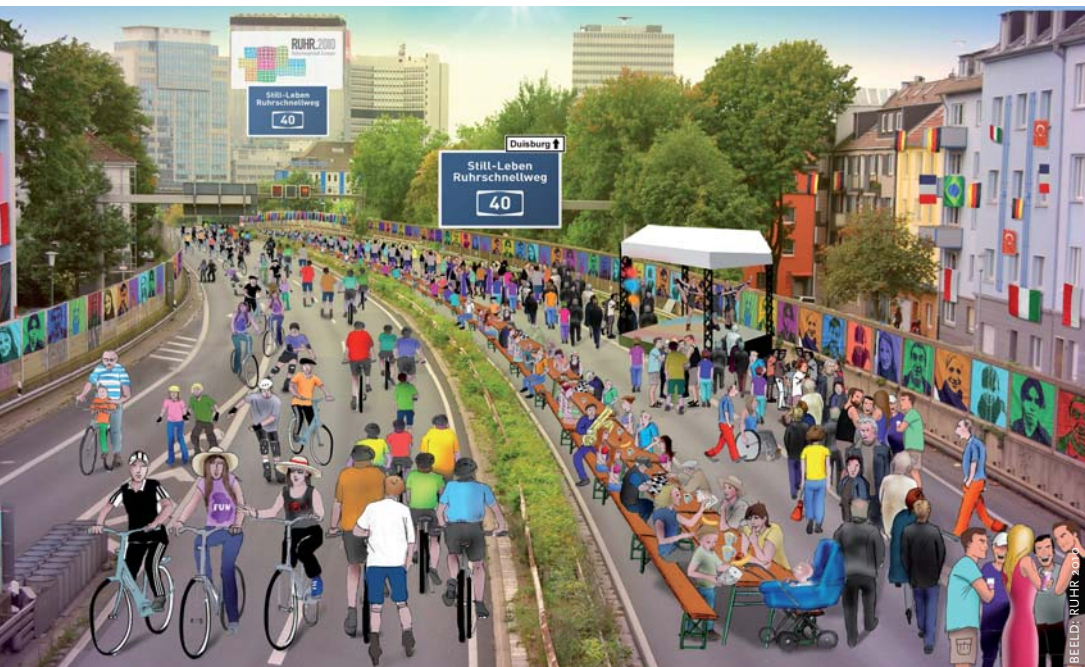
Still-Leben Ruhr Schnellweg A40: picknicken en fietsen op de A40 op 18 juli 2010, het jaar dat Essen culturele hoofdstad van Europa was.

Veel culturele activiteiten van hoog niveau bevorderen de lokale kenniseconomie en verhogen de aantrekkingskracht van de stad voor (potentiële) ondernemers en creatieve mensen van elders. Althans, zo is het geloof; onomstotelijke bewijzen zijn er niet. Als Eindhoven wordt uitverkoren, zal de Universiteit van Tilburg de effecten onderzoeken, inclusief de geografische verdeling van de baten over de vijf Brabantse steden. •