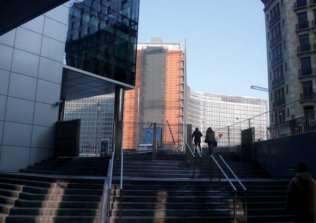
De Chaussee d'Etterbeek klimt tussen Lex en Résidence Palace door naar het Berlaymontgebouw.

wist daar nog 50% van te maken (uiteindelijk werd het 53,5%).