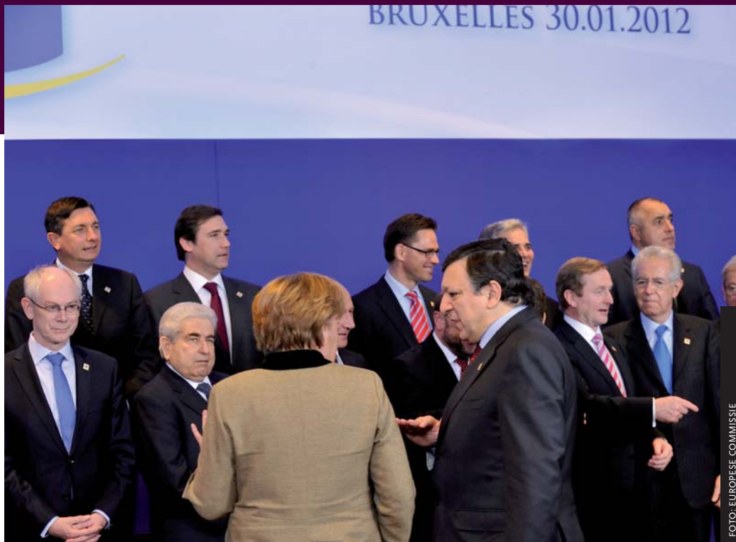
Op hoogtijdagen bevolken de prima donna's van de EU het Brusselse toneel, hier tijdens een 'informele' ontmoeting, bijeengeroepen door EU-president Herman van Rompuy op 30 januari 2012.

De tweede episode illustreert hoeveel invloed het ambtelijke apparaat heeft op de besluitvorming – in dit geval rond de eurocrisis. Het ging om het optuigen van het noodfonds