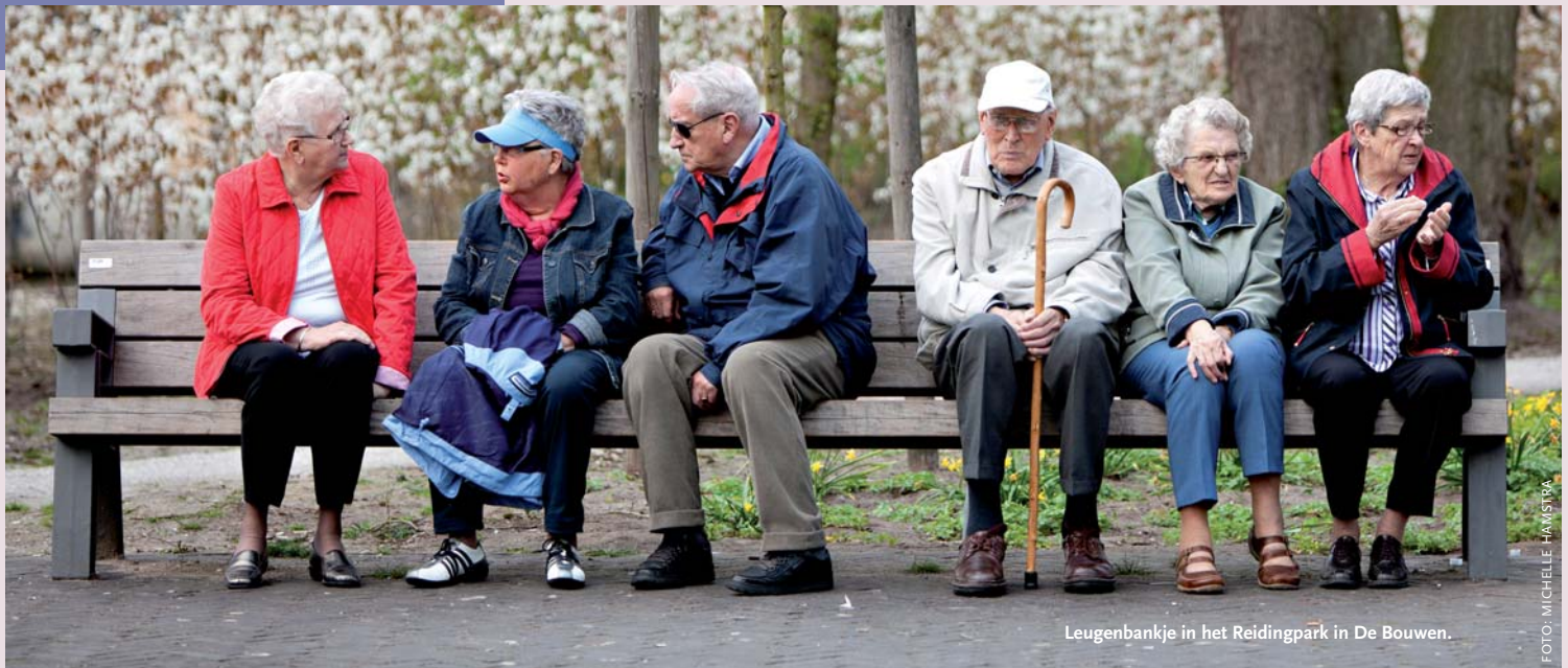
Leugenbankje in het Reidingpark in De Bouwen.