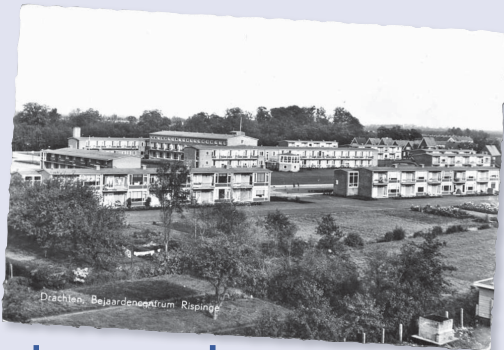
Drachten, Bejaardencentrum Rispinge