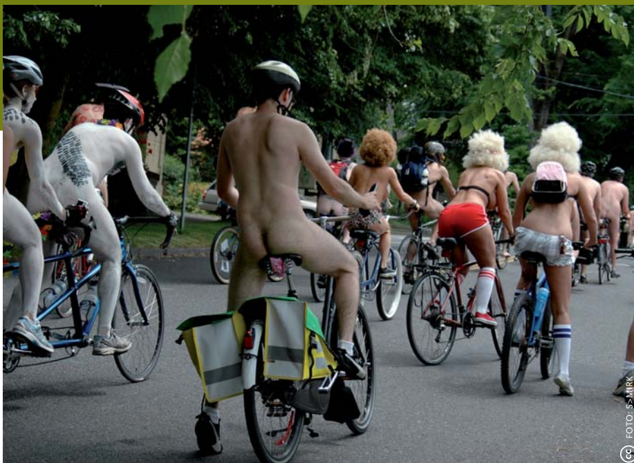
Staatjes van de niet-doorsnee-fietscultuur in Portland. Boven deelnemers aan de Naked Bike Ride. Onder toeschouwers van de Minibike Winter Ben Hurt Chariot Wars, een gladiatorengevecht op kleine fietsjes onder de snelweg.