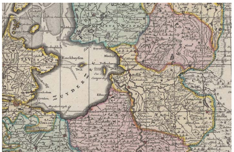
Fragment uit XVII Provinces des Pays-Bas suivant qu'elle sont a present partage: a l'usage de monseigneur le Duc de Bourgogne / par son t. h. serviteur H. Jaillot . Uitgave Jean Covens et Corneille Mortier, tweede kwart 18e eeuw. Schaal circa 1:900.000, kopergravure, handgekleurd, 50 x 59 cm.

De Nieuwe kaart van het Koninkrijk der Nederlanden en het Groothertogdom Luxemburg is de enige door François Bohn uitgegeven kaart in de Atlas der Nederlanden (IX:1). In de periode 1800-1830 bracht deze Haarlemse uitgeverij en boekhandel enkele tientallen kaarten uit. Vaak sloten ze aan bij actuele gebeurtenissen en ze zijn meermaals als kaartbijlagen in