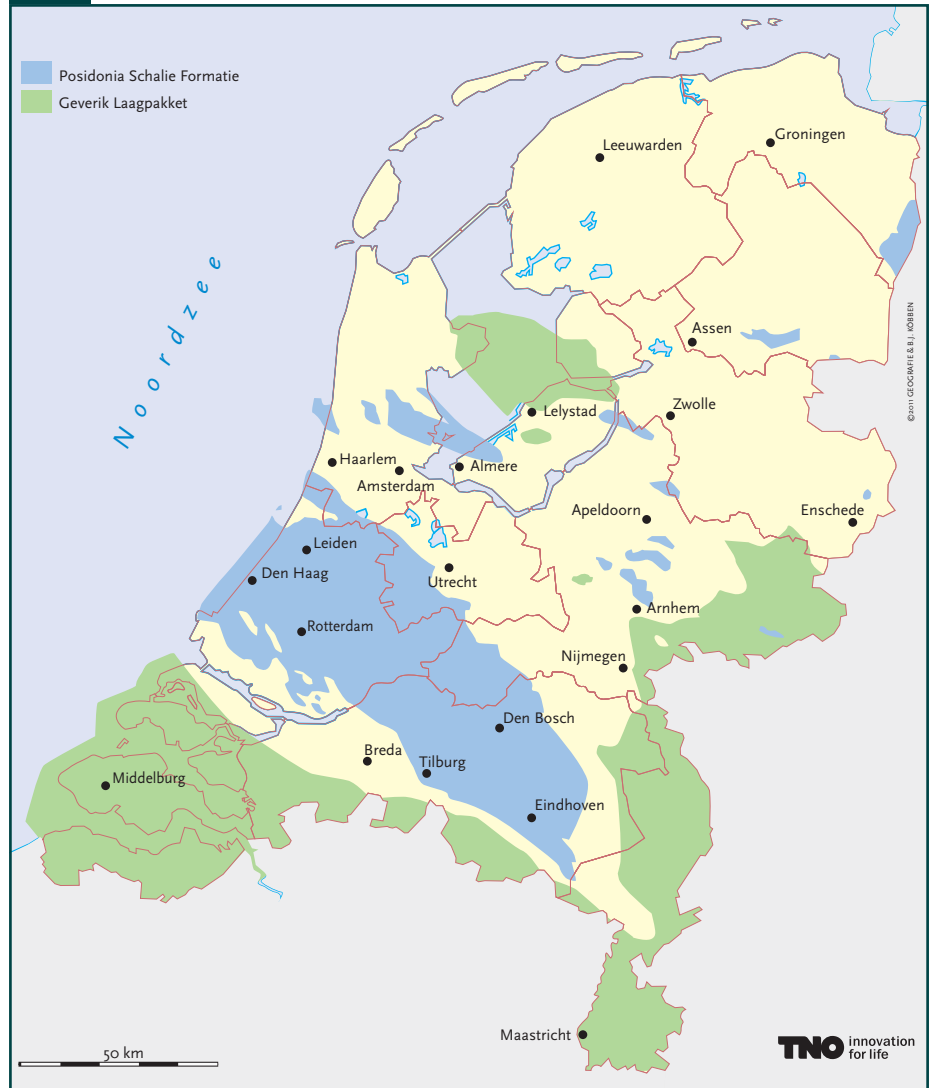
Figuur 2: Mogelijke locaties van schalieghashoudende lagen in Nederland

De schalieghashoudende lagen (de Posidonia Schalie Formatie en het Geverik Laagpakket) zien er onregelmatig uit door het actieve geologische verleden van de Nederlandse ondergrond.