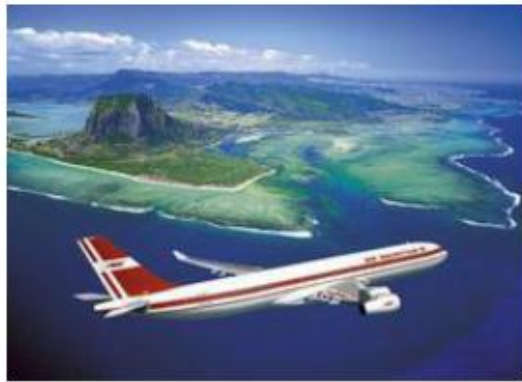
'We Love Mauritius'