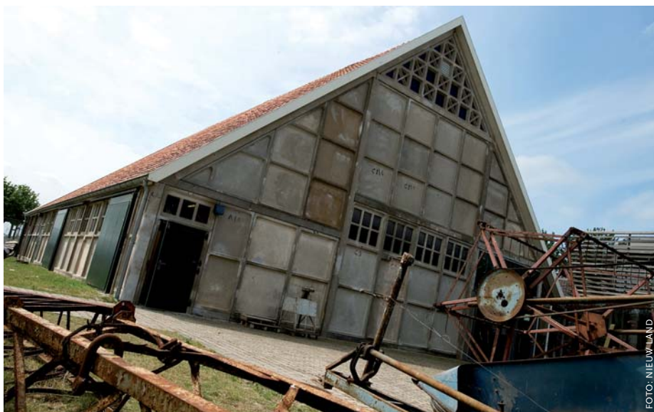
De typerende schokbetonnen 'Polderschuur' uit de Noordoostpolder.

De bomengordels waren ooit bedoeld als windvangers in de kale Noordoostpolder, maar geven de dorpen ook een vriendelijke uitstraling. Bomenaanplant is op veel plekken al een hele verbetering voor de ruimtelijke kwaliteit. De dorpen en agrarische erven zijn in de Noordoostpolder immers herkenbaar als groene oases. Van Assen laat in Tollebeek het bedrijventerrein zien. 'Het is mooi inge-