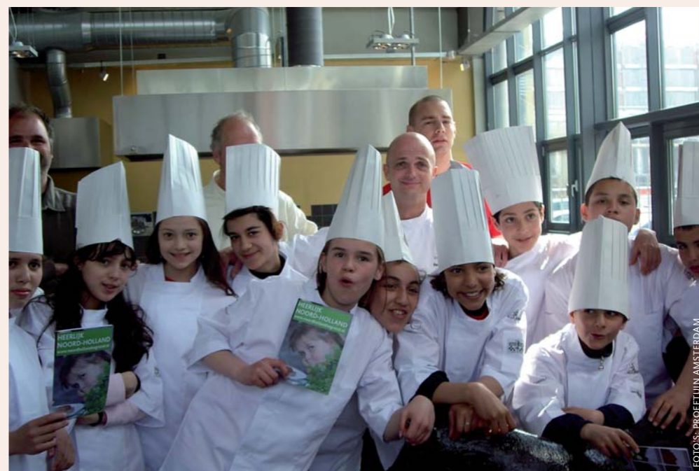
Onder: Opleidingsrestaurant The Colour Kitchen in Amsterdam Nieuw West praat de leerlingen bij over streekproducten uit Noord-Holland (2009).

stoffen, ondanks publieke controlemechanismen als de Keuringsdienst van Waren. Ook daarom willen steeds meer mensen zelf greep krijgen op hun voedsel. Streekproducten en vers en (h)eerlijk voedsel zijn in opmars. Grootwinkelbedrijven spelen daarop in en er ontstaan interessante nieuwe winkelformules, zoals Marqt, een kleine keten met vier filialen in Amsterdam en Haarlem, die een directe relatie met de producenten opbouwen.