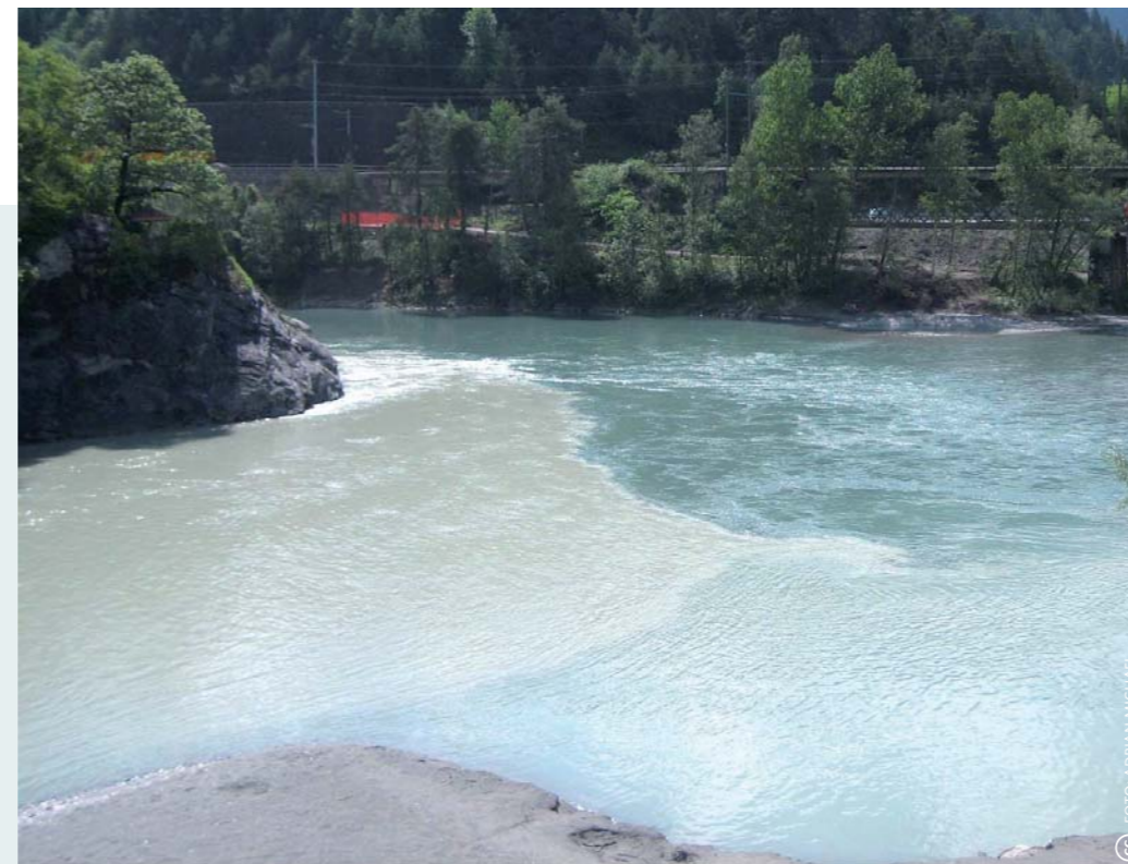
Bij Reichenau voegt de Hinterrhein zich bij de Vorderrhein. Het kleurverschil wordt veroorzaakt door het sedimentgehalte.

Er zijn drie rivieren die door gletsjersmeltwater worden gevoed (criterium 4): de Rein da Maighels, Landwasser en Hinterrhein. Op basis van dit criterium zouden de