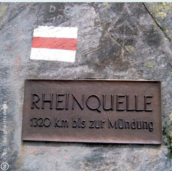
Volgens dit bordje bij de Tomasee ontspringt hier de Rijn.

In de buurt van de Oberalppas, bij de Tomasee op 2345 meter hoogte, hangt een bronzen bordje met daarop 'Rheinquelle, 1320 km bis zur Mündung'. Veel wandelaars ondernemen de tocht naar dit idyllische meertje, maar lopen ze wel goed? Als we uitgaan van wat je op school bij aardrijkskunde leert, ligt de bron nog zuidelijker.