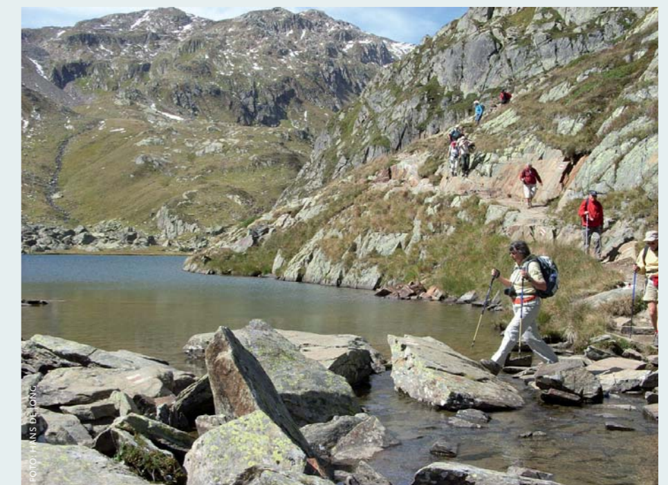
Op mooie zomerdagen is het filelopen naar de Tomasee, waar die beroemde rivier ontspringt.