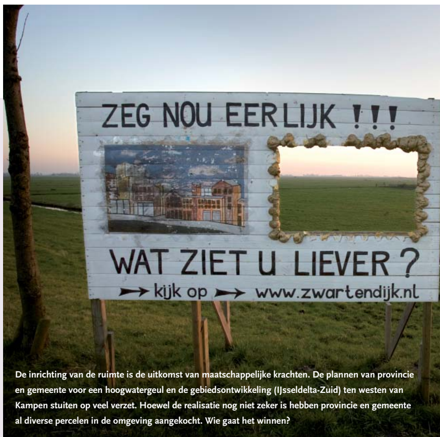
De inrichting van de ruimte is de uitkomst van maatschappelijke krachten. De plannen van provincie en gemeente voor een hoogwatergeul en de gebiedsontwikkeling (IJsseldelta-Zuid) ten westen van Kampen stuiten op veel verzet. Hoewel de realisatie nog niet zeker is hebben provincie en gemeente al diverse percelen in de omgeving aangekocht. Wie gaat het winnen?

De ruimte is geen vaststaand gegeven, maar de uitkomst van maatschappelijke krachten, een sociale constructie. Zo kan de voorgenomen sloop van een naoorlogse boerderij op het landgoed van Maxima en Willem-Alexander ineens uitgroeien tot een icoon van de arrogantie van het koninklijk huis. En komen de geplande luxe appartementen er (misschien) toch niet. Een interessant perspectief op ruimte, ook in het aardrijkskundeonderwijs.