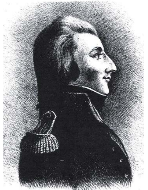
Ierse vrijheidsstrijder en naamgever van de band: Theobald Wolfe Tone (1763-1798)

De Wolfe Tones scheppen zo'n lieu de mémoire. The Irish Independent van 22 februari 1988 doet verslag van een optreden in Glasgow. Zo'n vijftig politieagenten houden de wacht buiten. Een dag eerder heeft 'The old firm' plaatsgevonden, de voetbalwedstrijd tussen het protestantse Glasgow Rangers en het katholieke Celtic. Celtic heeft gewonnen. Iedereen in de zaal draagt het groen-witte tenue van Celtic. Net als in Cork niet om te laten zien dat dit hun favoriete voetbalclub is, maar om de Iers-republikeinse voorkeur te