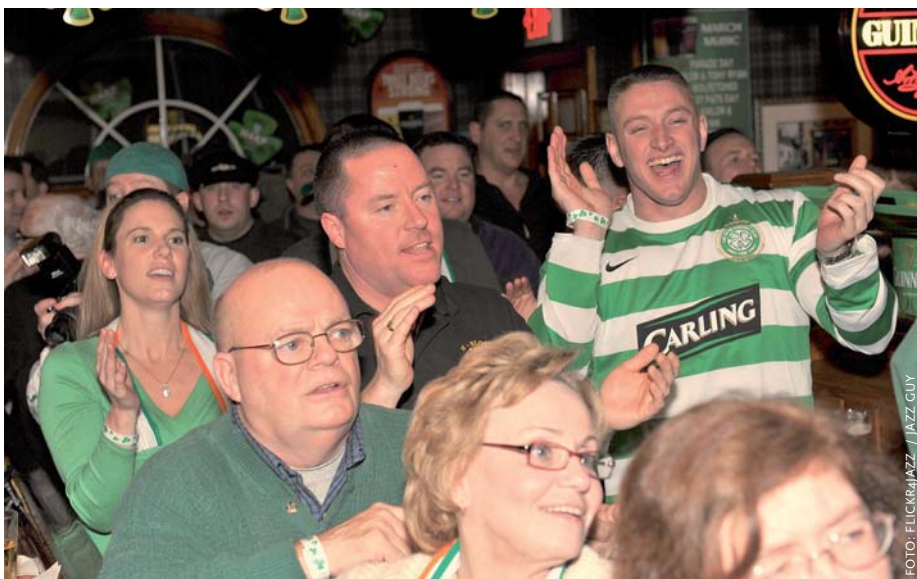
De Wolfe Tones in Harrigan's Pub in Sea Girt. Een deel van het publiek draagt shirts van de Celtic als uiting van hun Iers-republikeinse sympathieën.

De groep is genoemd naar de Ierse vrijheidsstrijder Theobald Wolfe Tone. Deze vocht in de 18de eeuw tegen de onderdrukking door de Engelsen, die Ierland gekoloniseerd hadden. Opvallend is dat Wolfe Tone een protestant was. Onder invloed van de Franse revolutie zocht hij samenwerking met de rooms-katholieken om te komen tot een vrije republiek Ierland waarin de religieuze overtuiging van de inwoners niet uitmaakte. Hij overtuigde de medeoprichters van de United Irishmen Society ervan dat alleen een gewapende opstand tegen de Engelsen tot dat resultaat kon leiden. Na twee mislukte invasies, eenmaal gesteund door een Franse vloot en eenmaal door een Nederlandse, die in de slag bij Kamperduin echter door de Engelsen verslagen werd, overlegde hij meermaals met Napoleon. Die had echter meer belangstelling voor Egypte. De opstand die Wolfe Tone in 1798 leidde was dan ook te klein om de Engelsen echt pijn te doen. Hij werd gevangene