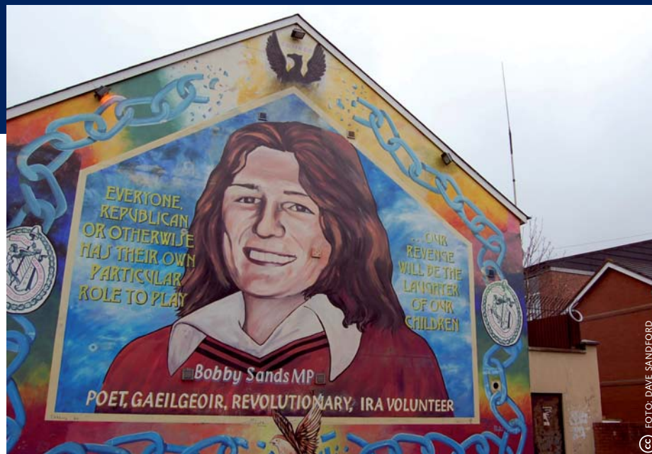
Muurschildering van Bobby Sands, de 26-jarige hongerstaker die in 1981 overleed en uitgroeide tot een symbool van de republikeinse strijd in Noord-Ierland.