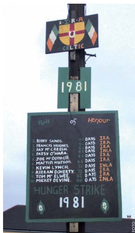
Geïmproviseerde heldenzuil in Derry/Londonderry.

fundamenteel, over de vraag wat we vinden van de wereld. Wat is goed en fout, belangrijk en onbelangrijk, mooi en lelijk. Maar die diep gevoelde waarden zijn moeilijk onder woorden te brengen. Daarvoor gebruiken we volgens Hofstede 'praktijken'. Drie van die praktijken noemt hij expliciet in zijn model: helden, rituelen en symbolen. Bobby Sands en de spelers van Celtic als helden, de vlaggen, de jaartallen en de naam Celtic als symbolen communiceren op deze paal de culturele waarden van militante katholieken in Noord-Ierland. En de paal als geheel dient als symbool om aan te geven dat op de betreffende locatie deze waarden 'op hun plaats zijn'.