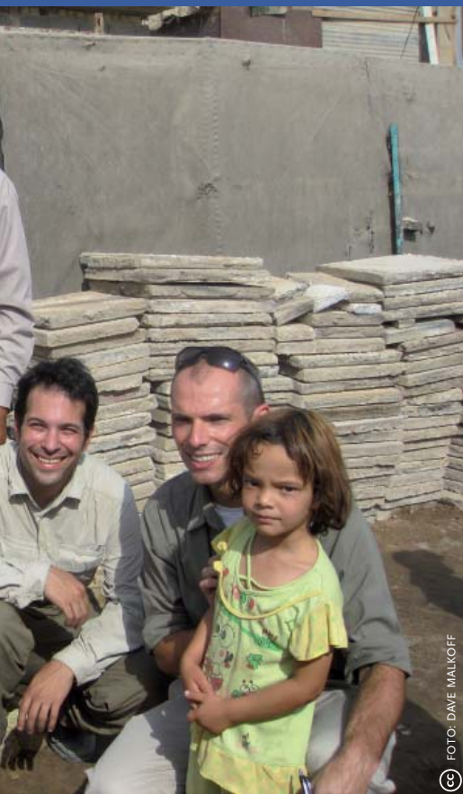
Vluchtelingenkamp Al-Gazalia in Bagdad.