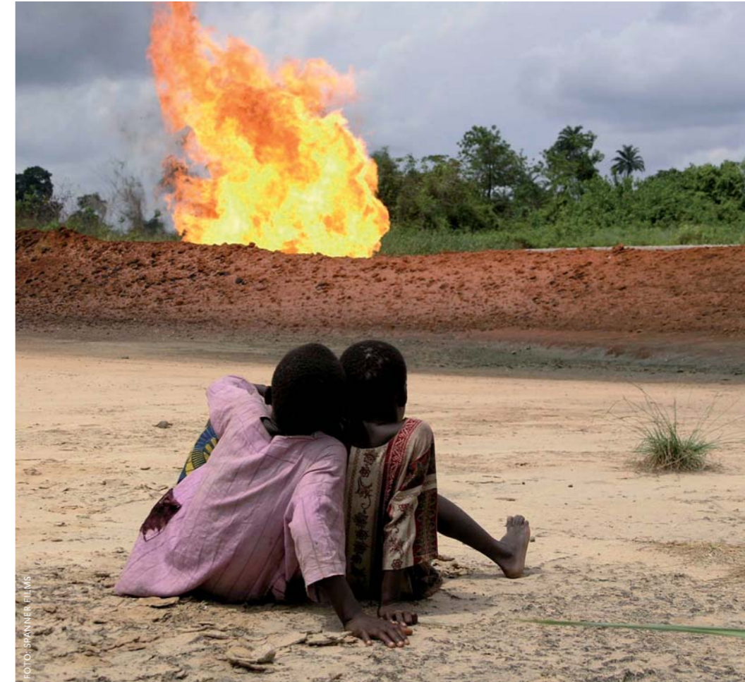
Kinderen kijken naar het affakkelen van gas bij de oliewinning door Shell in Nigeria.