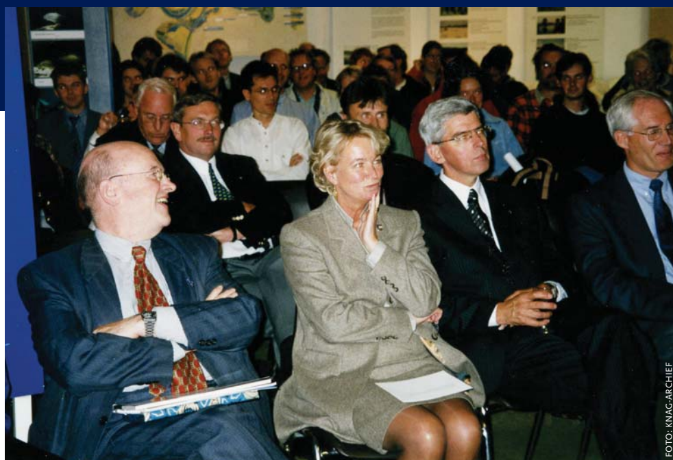
Staatssecretaris van Waterstaat Monique de Vries tijdens een KNAG-symposium over wateroverlast, oktober 1999.

Het KNAG heeft veel pogingen gedaan om als intermediair te fungeren voor de academisch geografen, de onderwijsgeografen en de praktijkgeografen. 'Het KNAG is er voor alle geografen.' Het aantal leden is echter bescheiden ten opzichte van het totale aantal geografen. Aanvankelijk telde het KNAG iets meer dan 2000 leden; in de jaren 80 steeg dit tot rond de 3000. Dit was waarschijnlijk een gevolg van het sterk toenemende aantal studenten en afgestudeerden in die periode. In de jaren 90 steeg het ledental tot gemiddeld zo'n 3300, met een maximum van 3563 in 1999. Na de millenniumwisseling zakte dit weer iets terug tot zo'n 3200.