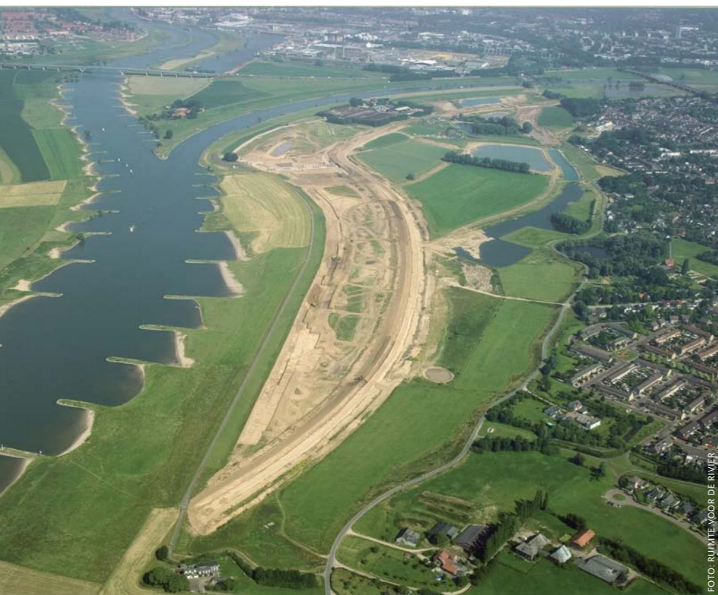
De Hondsbroeksche Pleij ligt bij de splitsing van de Neder-Rijn en de IJssel. Om het gebied tegen hoogwater te beschermen wordt een deel van de huidige Pleijdijk 150 tot 250 meter landinwaarts gelegd en de uiterwaard opnieuw ingericht.

het water in de rivier niet veel zal stijgen.