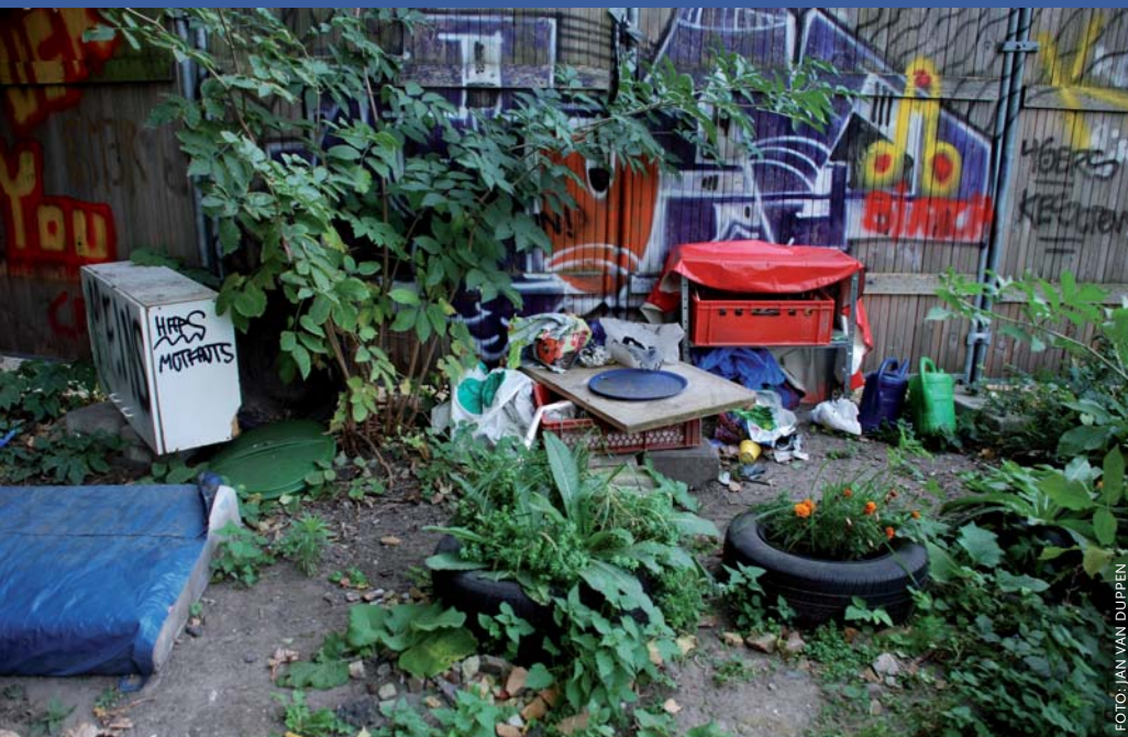
Guerrilla garden in een hoek van het terrein.

kantoorplannen voor het gebied. Daarnaast is de Berlijnse graffitiscene actief op de Cuvrybrache. Bijna elke dag verschijnen er nieuwe werken van graffiti-sprekers. Beginnelingen en sprekers van naam en faam ontmoeten elkaar. De grote muurschilderingen van de kunstenaar Blu springen direct in het oog. Deze werken hebben de Cuvrybrache bekend gemaakt bij een breed publiek. Toeristen kennen de beelden uit urban magazines , boeken en/of YouTube en komen om foto's te maken en underground Berlijn te ervaren.