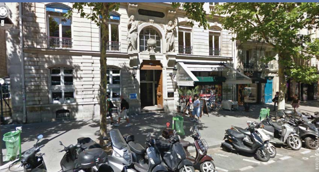
De Société de Géographie is sinds 1876 gevestigd in een statig pand in het Quartier Latin aan de Boulevard St. Germain 184, met op de benedenverdieping een eigen geografische boekhandel.

schappen heeft gediend. Het kost echter de grootste moeite om het monument in stand te houden – daarvoor zijn de financiën ontoereikend.