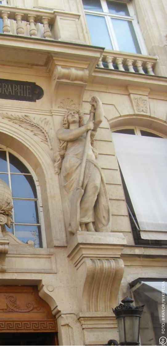
Het allereerste genootschap, de Société de Géographie in Parijs, opgericht in 1821.