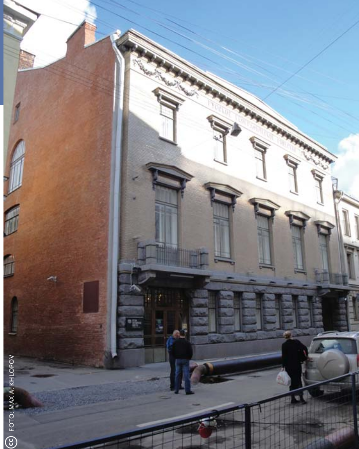
Het monumentale hoofdkwartier van het Russische Geografisch Genootschap in Sint Petersburg ondergaat een grondige restauratie.

1960-1966 Vooral onder druk van de verliesgevende uitgave van het TAG besluit het