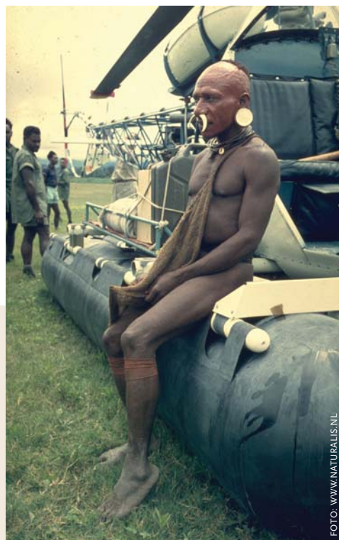
Laatste KNAG-expeditie, Sterrengebergte, Nieuw-Guinea, 1959. Papoea Delek bij helikopter.

In Frankrijk ten slotte maakt het veld van geografische organisaties een verbrokkelde, maar redelijk vitale indruk. De Société is sedert 1876 gevestigd in een statig pand in het Quartier Latin aan de Boulevard St. Germain 184. Ze geeft nog een blad uit dat een tijd in de kiosken verspreid is, maar dat was kennelijk niet vol te houden.