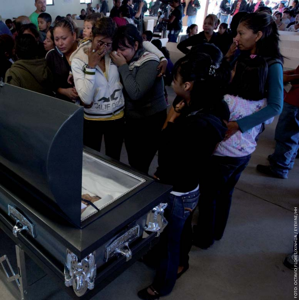
Een gewapende bende richtte op 24 oktober 2010 een bloedbad aan tijdens een feest in Ciudad Juarez aan de grens met de VS. Er vielen vijftien slachtoffers, waaronder kinderen.