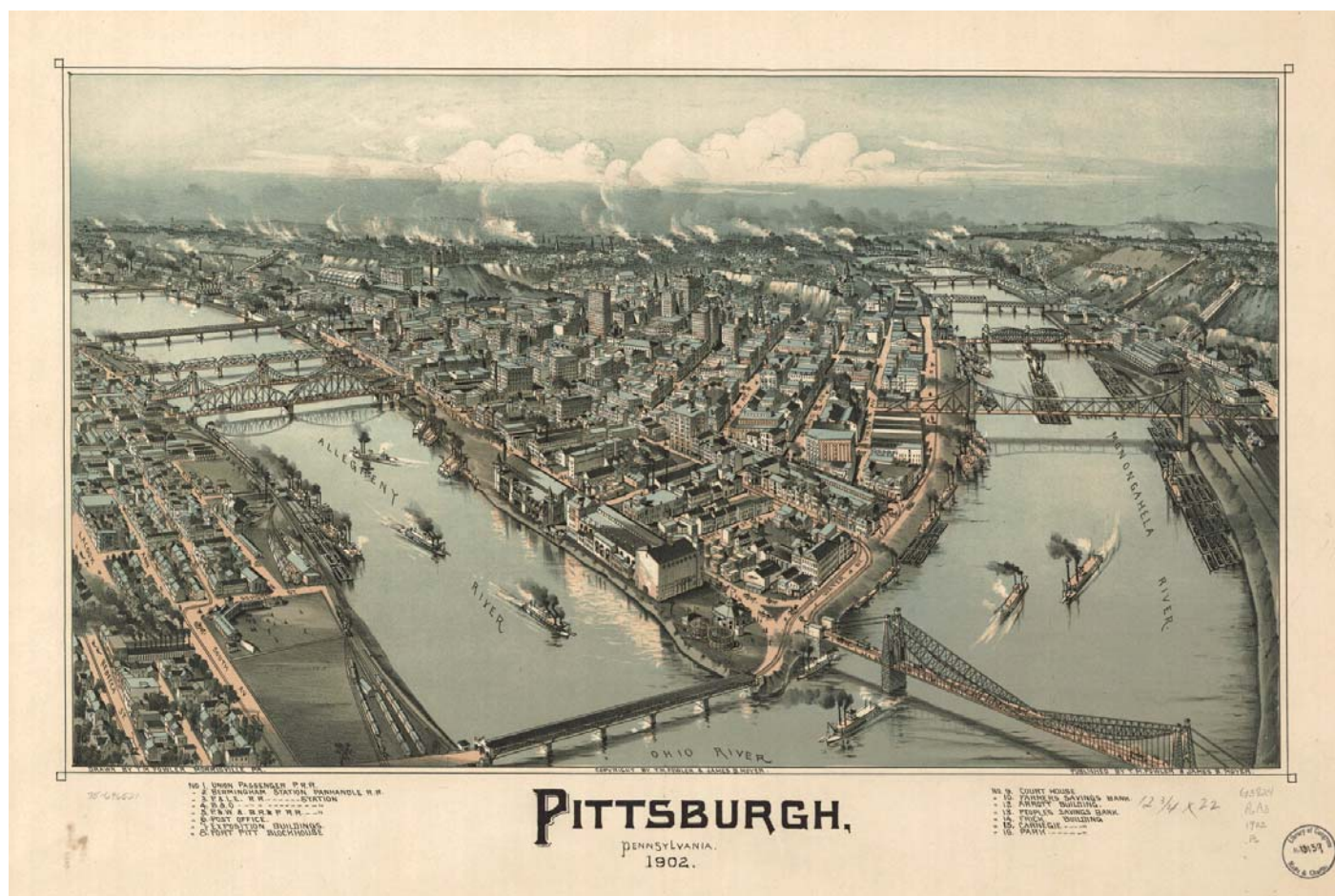
Pittsburgh in 1902. Tekening van T. M. Fowler, uitgegeven door T. M. Fowler & James B. Moyer.