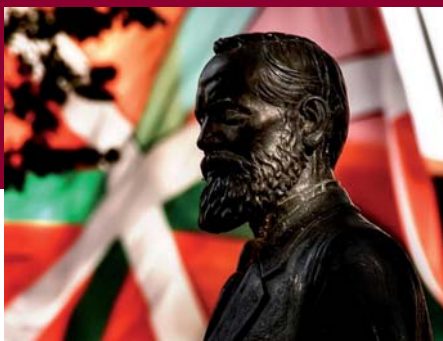
Sabrino Arana met de Baskische vlag die hij zelf ontwierp.