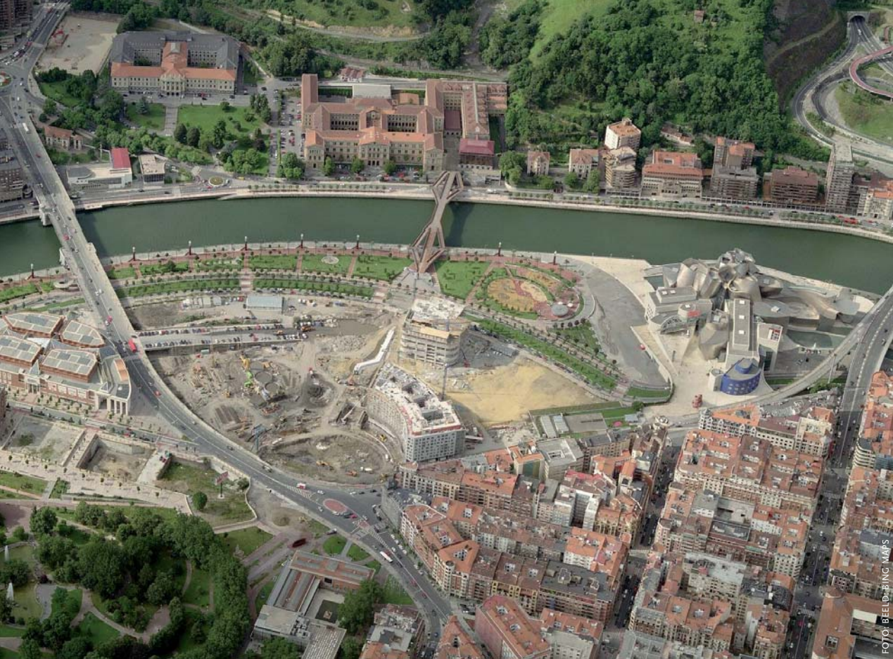
Stedelijke ontwikkeling met Guggenheim Museum op het Abandoibarra-terrein, waar tot 1987 een scheepswerf lag.

was inmiddels te klein. Krens bezocht onder andere Salzburg, Tokio, Moskou, Wenen en Londen, maar vond nergens gehoor voor de eisen van zijn stichting.