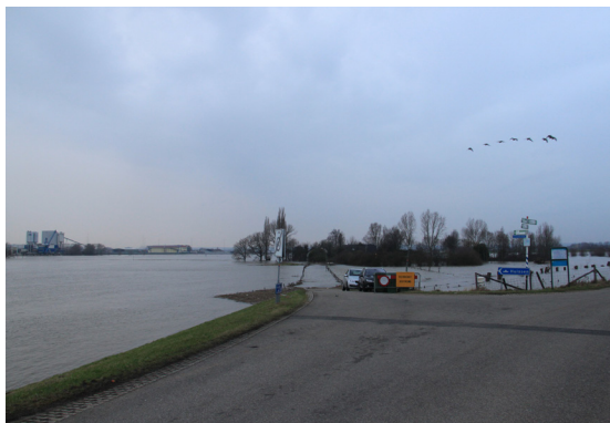
BRON 4 Afgesloten toegangsweg tot het Looveer bij Westervoort via een terp in de uiterwaard. 17 januari 2011.