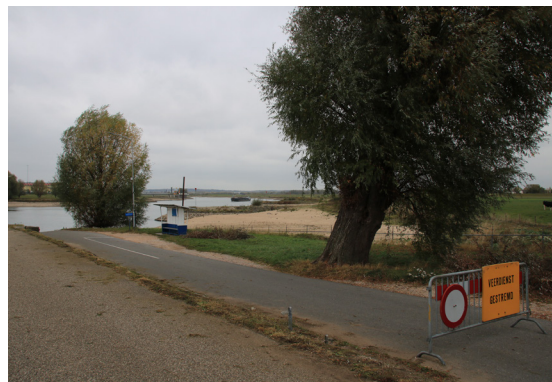
BRON 5 Afgesloten toegangsweg tot het Looveer bij Westervoort aan de gedeeltelijk drooggevallen rivier. 26 oktober 2018.