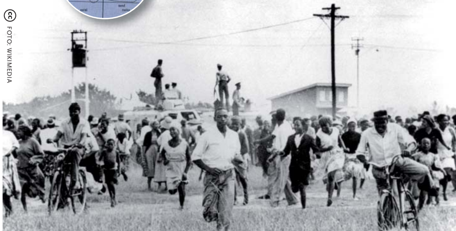
Sharpeville 21 maart 1960. Bij de protesten tegen de pasjeswetten schiet de politie met scherp; 69 mensen komen om.

conclusie: 'Haar ontgoocheling houdt steeds gelijke tred met het politieke trauma van haar land: een volk afgesneden van de toekomst, ergens in het verleden op hol geslagen en in een heel aparte cul-de-sac van de tegenwoordige tijd verzeild geraakt'.