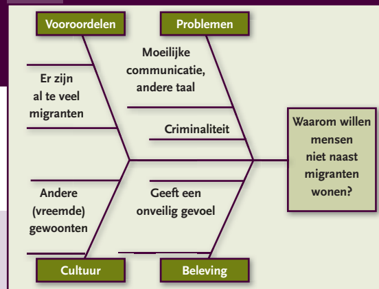
Figuur 3: Fishbone

of buitenlandse werknemers te wonen? De leerlingen moeten eerst individueel en later in groepjes redenen bedenken en categoriseren waarom mensen niet naast migranten willen wonen. Ze maken daarbij gebruik van een fishbone , een schema om verschillende aspecten, oorzaken of gevolgen van een complex thema te bestuderen (figuur 3).