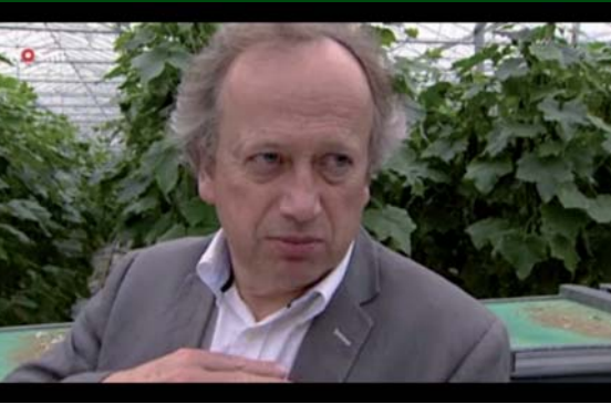
Staatssecretaris Henk Bleker op bezoek bij gedupeerde komkommerkwekers in het Westland.