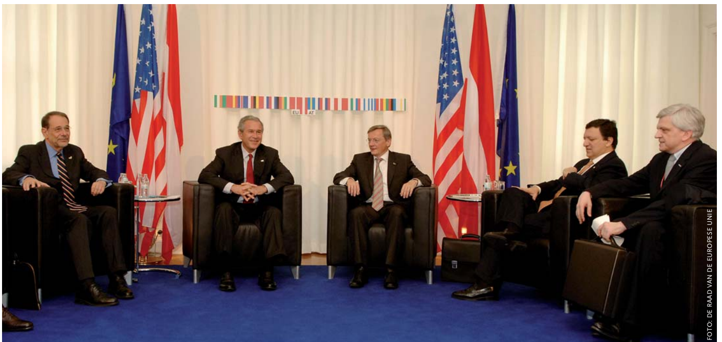
Deze foto van de VS-EU-top in 2006, met Javier Solana direct links van president George W. Bush, laat zien hoe serieus de Spanjaard werd genomen als Hoge Vertegenwoordiger voor het Gemeenschappelijk Buitenlands en Veiligheidsbeleid van de EU.

In 1978 was al een democratische grondwet aangenomen die de sterke regionalismen binnen Spanje in het staatsbestel verankert. De regio's worden aangeduid als 'autonome gemeenschappen'. Hun bevoegdheden zijn grondwettelijk vastgelegd en kunnen alleen met instemming van regio en rijk veranderd worden. Hoewel Spanje officieel niet zo heet, gaat het in feite om een federatie. De mate van autonomie van de gemeenschappen verschilt onderling wel aanzienlijk. De histo-