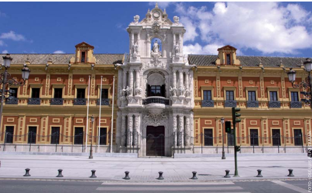
Europa betaalde mee aan de restauratie van het Palacio de San Telmo in Sevilla. In het gebouw huist nu de regionale regering van Andalusië.

aan dat migratie niet langer nodig was. Spanje werd een grote exporteur van landbouwproducten. Franse boeren kwamen in verzet en blokkeerden grensovergangen en tolwegen om Spaanse vrachtauto's met tomaten en dergelijke de doorgang te beletten. Omgekeerd veroorzaakten de overgang naar internationale marktverhoudingen en het Europese landbouw- en visserijbeleid ook grote problemen in Spanje. Zo mochten Spaanse vissers niet meer in Marokkaanse wateren vissen vanwege een conflict tussen de EG en Marokko.