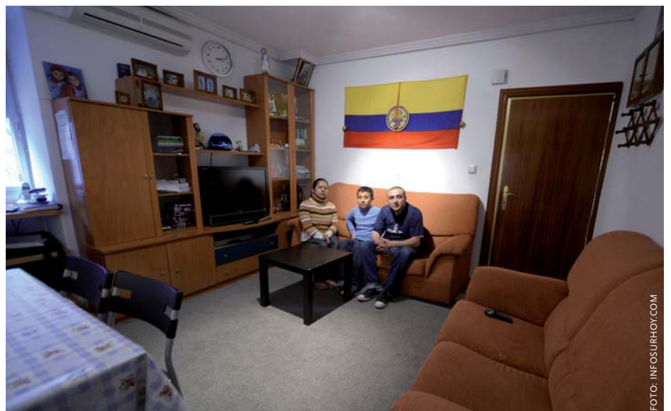
Net als deze Colombiaanse migrantenfamilie zijn er tegenwoordig velen: ze willen terug naar hun land van herkomst. Het leven in Spanje is te duur geworden sinds ze werkloos zijn door de crisis.

het Spaanse economisch wonder. Spanje beleefde vanaf 1996 een ongebreidelde economische groei, die vergezeld ging van een snel toenemende vraag naar laag- en ongeschoolde arbeid, in bijvoorbeeld de bouw, de horeca en de (particuliere) dienstverlening. De aanwezigheid van een relatief omvangrijke informele economie in Spanje droeg tevens bij aan gunstige arbeidsmarktvooruitzichten voor migranten: in de landbouw en de particuliere dienstverlening konden migranten ook zonder papieren snel aan het werk. Ook vergrijzing speelde een rol: direct door het vrijvallen van arbeidsplaatsen, en indirect doordat er vraag kwam naar zorg voor ouderen. Daarnaast begaven Spaanse vrouwen zich in toenemende mate op de arbeidsmarkt waardoor – naast