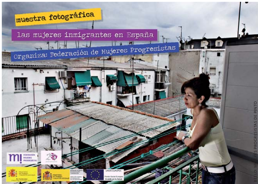
Poster van een foto-expositie die de bevolking oproept oog te blijven houden voor de belangen van (vrouwelijke) migranten die de Spanje economie zo lang draaiende hebben gehouden.

jonge migranten kregen het zwaar te verduren: meer dan 45% van de migranten jonger dan 25 zit zonder werk. Dit is meer dan waar ook in de EU.