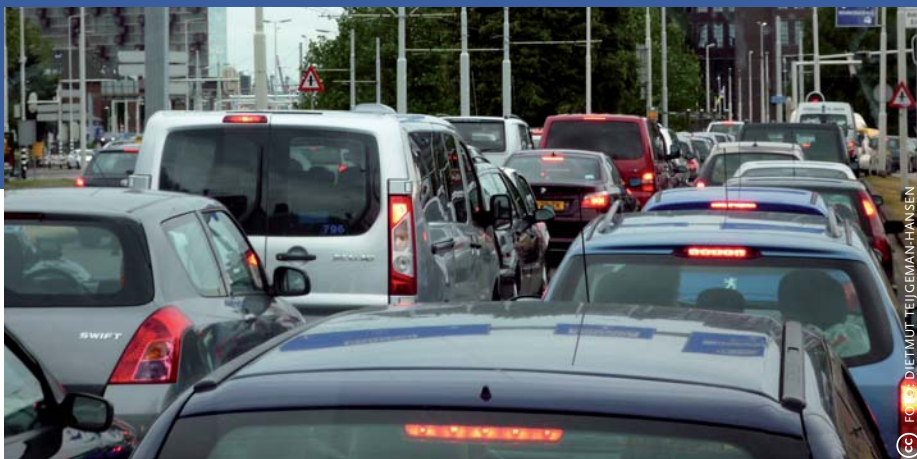
Figuur 3: Emigratiebestemmingen van 20-45-jarigen (2009)

Veel autochtone emigranten ervaren Nederland als vol en druk, en kiezen voor rust, ruimte en natuur.