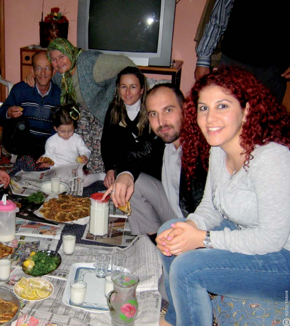
Het islamitische Offerfeest (Kurban Bayram) vier je in Turkije natuurlijk met de hele familie – hier in Tarsus, een stad tussen Mersin en Adana dichtbij de Zuidkust.

het sociale klimaat (hoe mensen met elkaar omgaan) en het politieke klimaat.