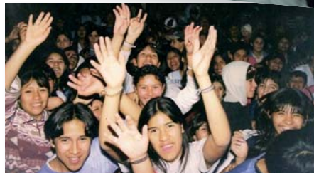
Jongeren uit Villa 31 hebben een druk digitaal leven en zetten honderden foto's en filmpjes van school, familie, vrienden en zichzelf op hun profiel. Ook het lokale radiostation FM 88.1 is zeer actief op Facebook.

ders nauwelijks hoe het er in sloppenwijken aan toegaat. Kinderen uit sloppenwijken met internettoegang en Facebook, met mobiele telefoons en fotocamera's, met verstand van Nederlands voetbal en muziek, dat strookt niet met het beeld dat Nederlanders hebben van sloppenwijken. Ons beeld blijkt vooral gebaseerd op de tv-beelden van Afrikaanse sloppenwijken en films als het Indiase Slumdog Millionaire . En toch is Villa 31 met zijn spontane, ongecontroleerde urbanisatie, criminaliteit, onzekerheid en uitsluiting in alles een sloppenwijk.