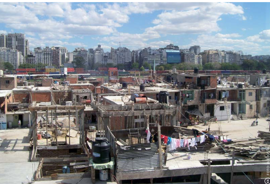
De sloppenwijk wordt door een spoorweg gescheiden van het business district van Retiro. Die ligging biedt kansen op baantjes in vooral de bouw en de schoonmaaksector.

Enkele maanden later in Nederland heb ik nog steeds contact. De avond van de afscheidsbarbecue hebben ze mij als ‘vriend’ toegevoegd op Facebook en kan ik de foto’s van die avond al op internet zien. Inmiddels ben ik met zeventien leerlingen bevriend op Facebook .