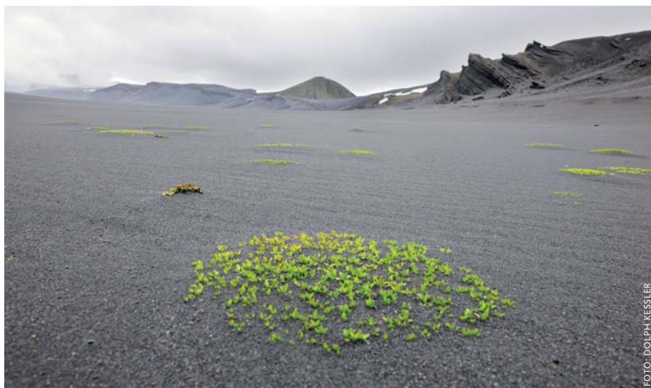
Het ontluikende groen tussen de grijze kiezels op het strand geeft nog wat kleur.

'Als wackere kooplieden, altijd kloek op 't gewin' hadden de heren van de Compagnie voorgesteld 'eenige scheepsgasten' op 'Mauritius' – waarmee wel degelijk Jan Mayen werd bedoeld – te laten overwinteren. Er werd een houten huis gebouwd en een magazijn met voedsel voor negen maanden, waaronder citroensap en rozijnen tegen de scheur-